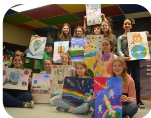
CLUB LIONS PRINCEVILLE

Bravo à tous les participants pour toutes vos belles œuvres.