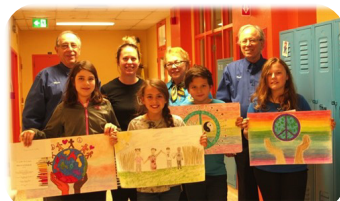
CLUB LIONS BRANCHE DES SOURCES